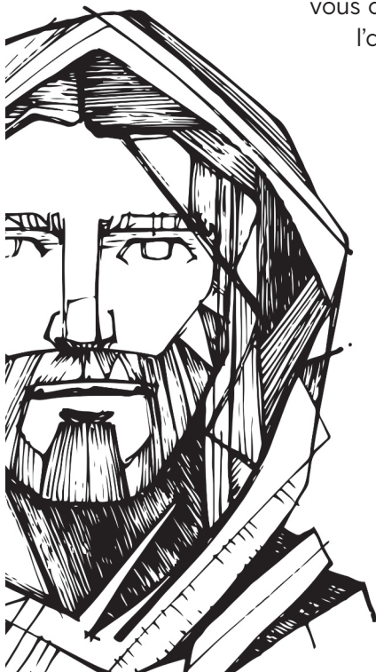
Cartographie de la maquette : Jérémie

36 Et ne jure pas non plus sur ta tête, parce que tu ne peux pas rendre un seul de tes cheveux blanc ou noir. 37 Que votre parole soit "oui", si c'est "oui", "non", si c'est "non". Ce qui est en plus vient du Mauvais. »