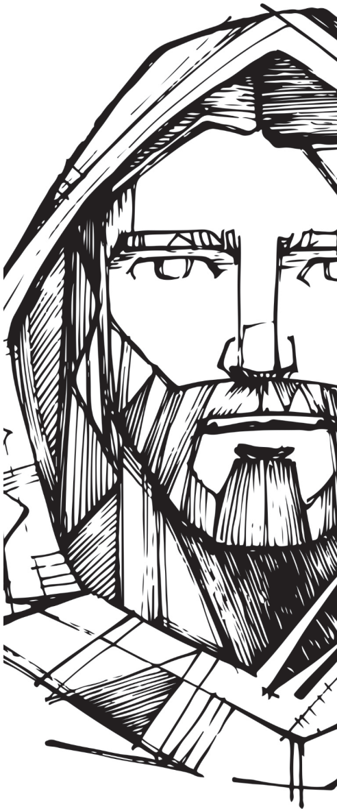
Conception de la maquette : Jérémie Laliberré Préparation du feuillet biblique : Yves Guérette