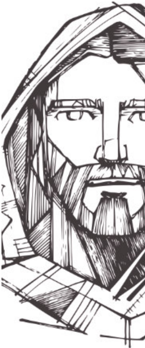
Conception de la maquette : Jérémie Laliberté Préparation du feuillet biblique : Yves Guérette

40 De ces deux commandements dépend toute la Loi, ainsi que les Prophètes. »